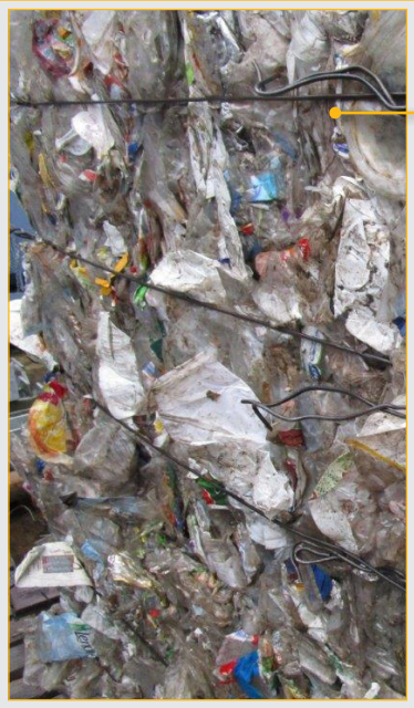
Input: Verunreinigte PET-Trays

Referenzanlage: Frankreich, ca. 2,0 t/h Input-Kapazität